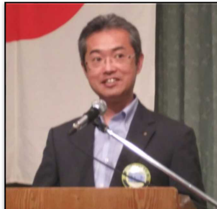
クラブ広報委員会 委員長 菅生会員