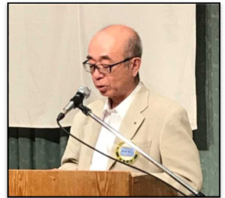
ロータリー財団委員会 がん予防推進委員会 委員長 新開会員