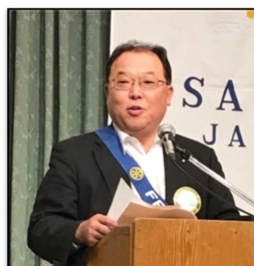
親睦委員会 委員長 栢本会員