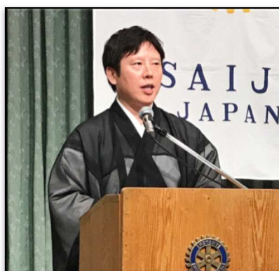
プログラム委員会 副委員長 廣幡会員